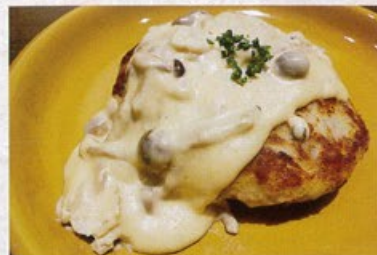
「真鱈と車麩のハンバーグ ～良寛牛乳のホワイトソースがけ～」 【店舗名:ダイニングレストランDIO】