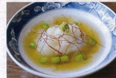
「鯛のかぶら蒸し」 【店舗名:大衆割烹 味彩】