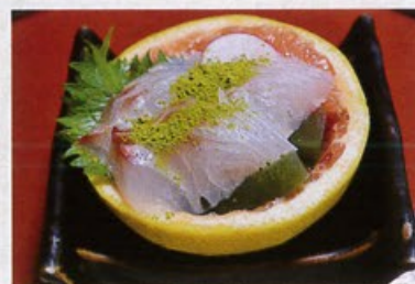
「初夏の鯛の前菜」 【店舗名:割烹旅館 山崎】