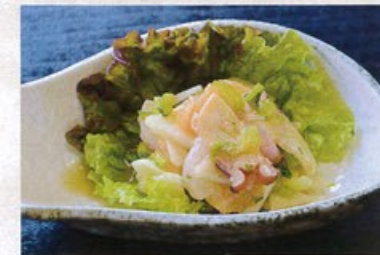
「カブ・エビ・タコの柑橘サラダ」 【店舗名:割烹御宿 たまきや】