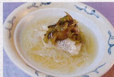
「鯛のつべ」 【店舗名:割烹なごみの宿 佐平次】