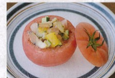
「サザエと彩り野菜の冷製トマトファルシ」 【店舗名:越後出雲崎天領の里 レストラン陣や】

●【割烹御宿 みよや】 国登録有形文化財に指定されている「割烹御宿 みよや」は、フリースペースですので、店外にて浜焼きや地ビールを買ってご自由にお召し上がりください! また、みよや店内でもご希望があれば、ビール等を販売します。 ※混雑状況によってはお待ちいただく場合がございますのでご了承ください。